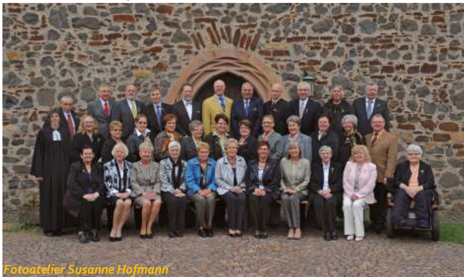
Fotoatelier Susanne Hofmann