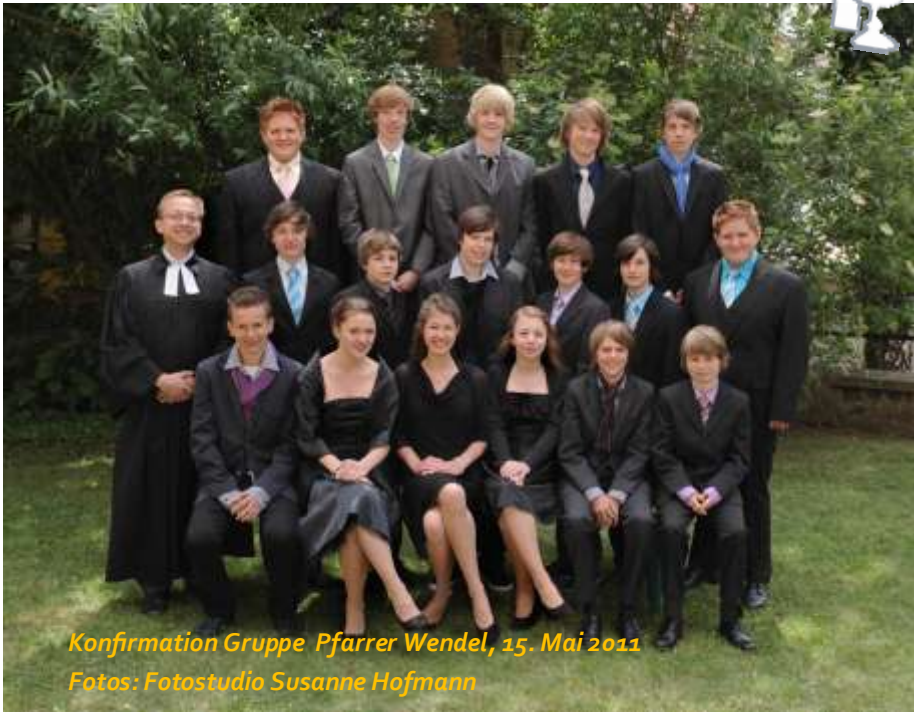
Konfirmation Gruppe Pfarrer Wendel, 15. Mai 2011