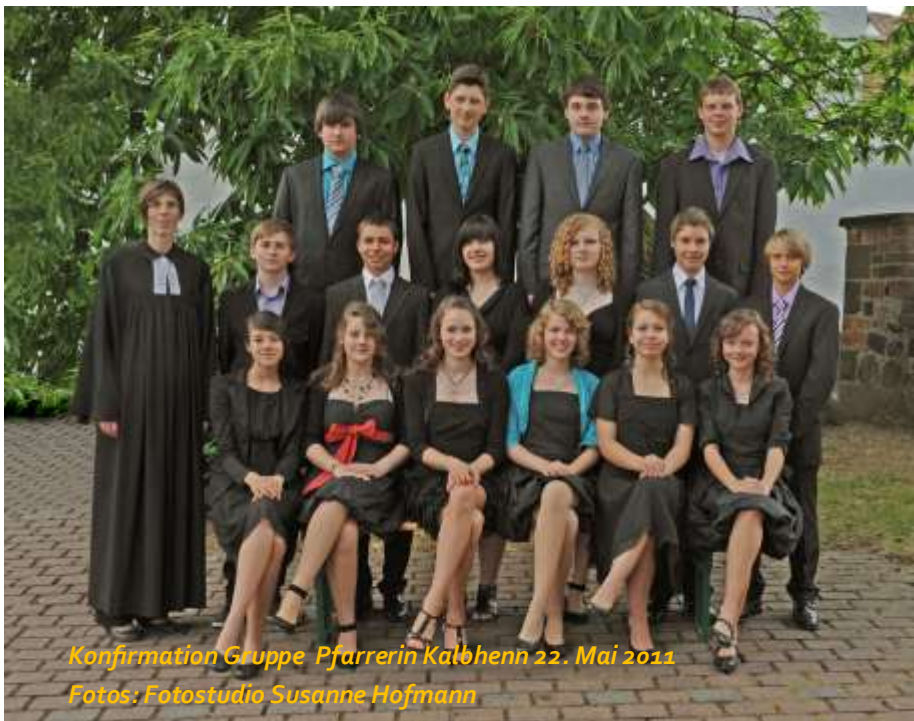
Konfirmation Gruppe Pfarrerin Kalbhenn 22. Mai 2011